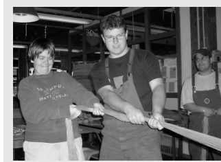
Gemeinsam an einem Strang ziehen